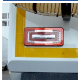
Feux à LED