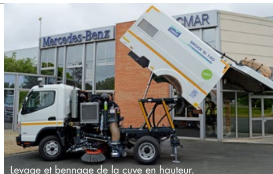
Levage et bennage de la cuve en hauteur.