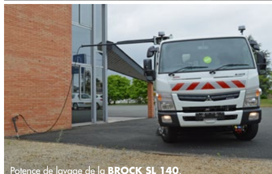
Potence de lavage de la BROCK SL 140 .