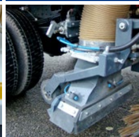
Pompe manuelle pour lever la cuve