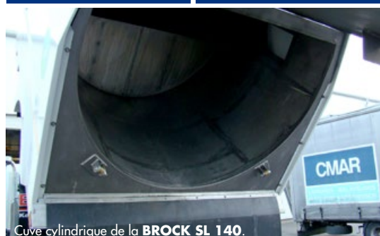
Cuve cylindrique de la BROCK SL 140 .