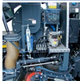
Groupe moteur turbine