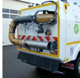
Potence aspiration arrière, avec vanne de décantation

En plus, elle a tous les atouts d'une grande : puissance d'aspiration, robustesse, qualité et simplicité d'utilisation.