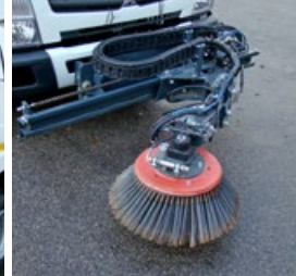
Balai frontal sur plaque Setra